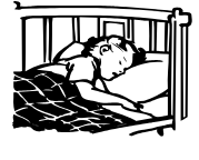
Réveiller le monde le matin