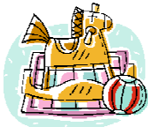
Tailler un jouet