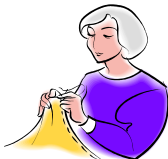
Racommoder les habits