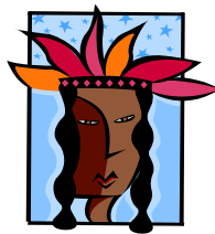
Tresser les cheveux