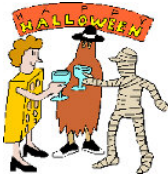
Faire des costumes