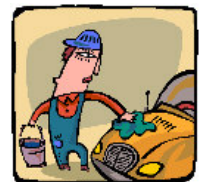
Laver la voiture