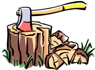
Couper du bois