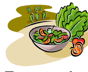
Entretien un potager