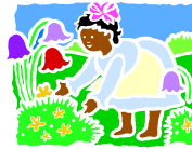
Entretien un parterre de fleurs