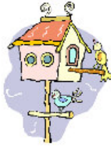
Construire un abri pour les oiseaux