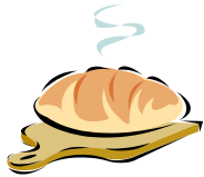
Cuire le pain