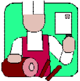
Tuer les animaux