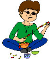
Enfiler des perles