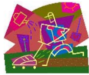
Tondre le gazon