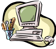
Utiliser un ordinateur