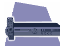
Programmer un magnétoscope