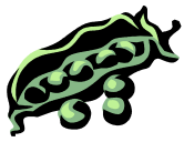
Éplucher des fèves