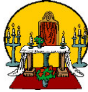
Créer un autel domestique