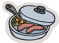
Faire la cuisine à l'intérieur