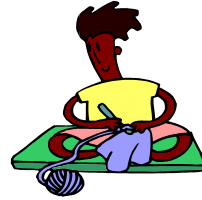
Faire de la tattine, ou du crochet