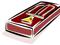
Vider les trappes à souris