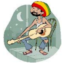
Jouer des instruments