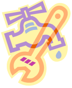
Réparer les fuites d'eau