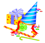
Planifier une fête